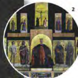
1. Arnaldo Pomodoro, La luna e la torre , 1955. A Palazzo Reale. 2. Piero della Francesca, Madonna della Misericordia . A Palazzo Marino.

capi d'abbigliamento, oggetti di ecodesign e prodotti bio-cosmetici, tutto a impatto zero (via Thaon di Revel 21, fonderianapoleonica.it). Il 21/12, al Teatro dal Verme , concerto a sostegno dell'Opera San Francesco per i Poveri con musiche settecentesche, da Vivaldi a Il Barbiere di Siviglia , eseguite dall'orchestra Barocca di Venezia (via San Giovanni sul Muro 2. Da 11 a 60 €. Prenotazioni: tel. 02.46.54.67.467).