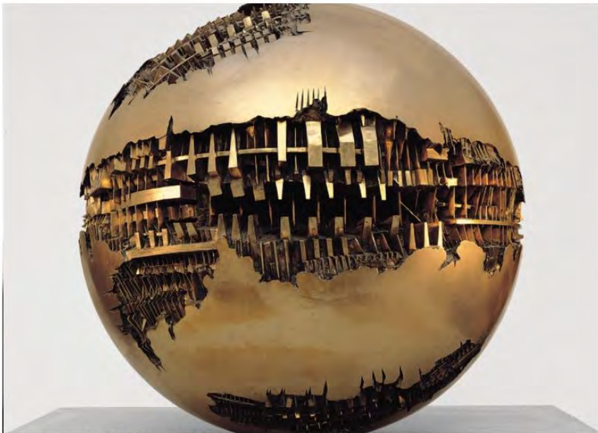
Arnaldo Pomodoro, Sfera n. 1, 1963 bronzo, ø 120 cm