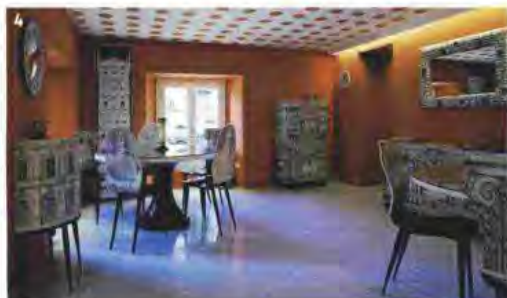
3. Il nuovo Lego Store , in corso Monforte: è il più grande d'Italia. 4. Lo showroom Fornasetti , in corso Venezia.

Brian&Barry Building (via Durini 28, tel. 02.76.00.55.82, tutti i giorni fino alle 21). Fornasetti , storico marchio del design e dell'arredamento italiano, ha inaugurato il proprio showroom nel palazzo in stile neoclassico dove visse il giovane Filippo Tommaso Marinetti, iniziatore del Futurismo. Tre piani di accessori, mobili, quadri, candele, piatti, in un allestimento che è di per sé un'opera d'arte (c.so Venezia 21, tel. 02.84.16.13.74). È il più grande d'Italia il Lego store appena aperto in San Babila. Fra le novità, l'Immersion portal , una grande teca trasparente, dove i bambini possono entrare per osservare da vicino speciali ambientazioni create con i mattoncini, e il Minifigures Scanner , per scoprire il proprio sosia in versione Lego (corso Monforte 2).